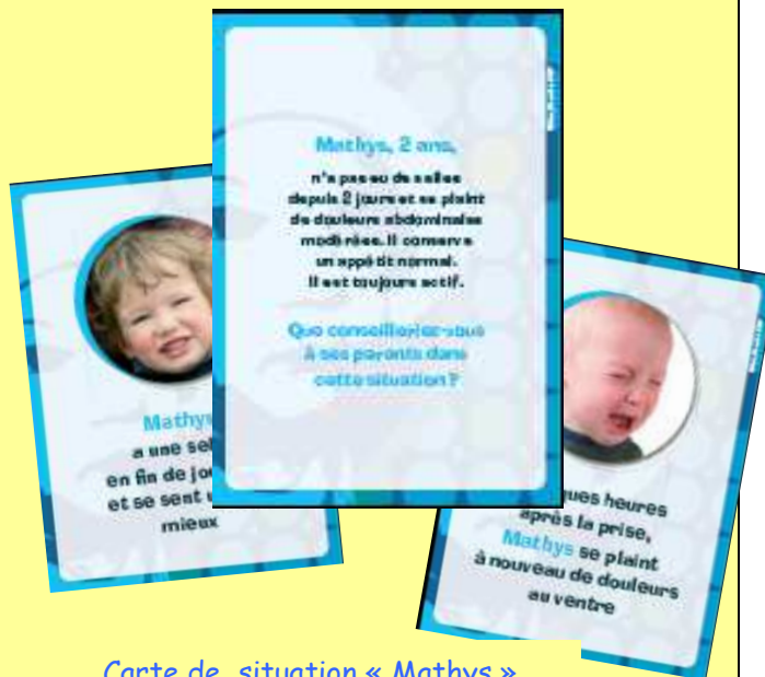
Carte de situation « Mathys »