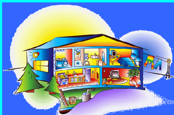
Diaporama « maison »

4 : Un bilan pour faire le point : L'évaluation